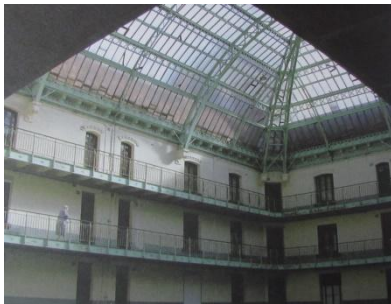
de binnenhal van een woonblok in de Familistère Godin