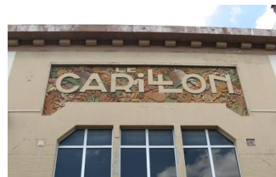
art deco in Saint-Quentin