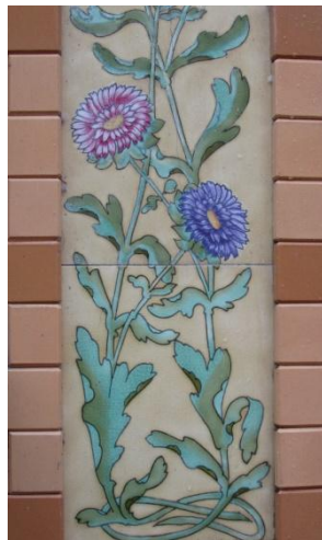
art nouveau-tegels in Ath